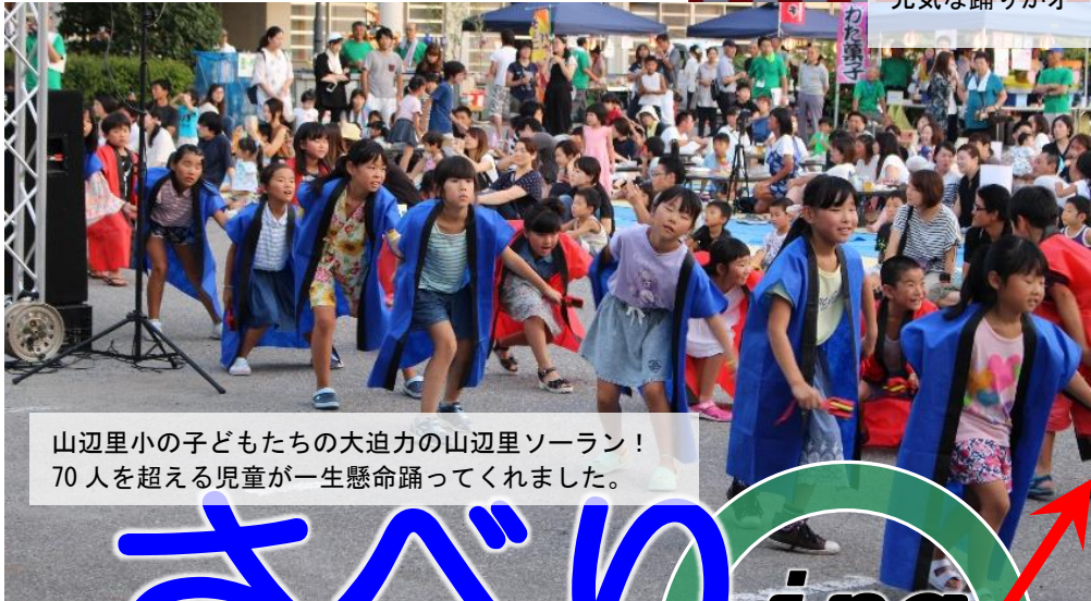
山辺里小の子どもたちの大迫力の山辺里ソーラン！ 70人を超える児童が一生懸命踊ってくれました。

8月4日（土）村上農村環境改善センターで「第5回ふれあいフェスタ in さべり」を開催しました。 詳しい内容は2～3ページに掲載しています。