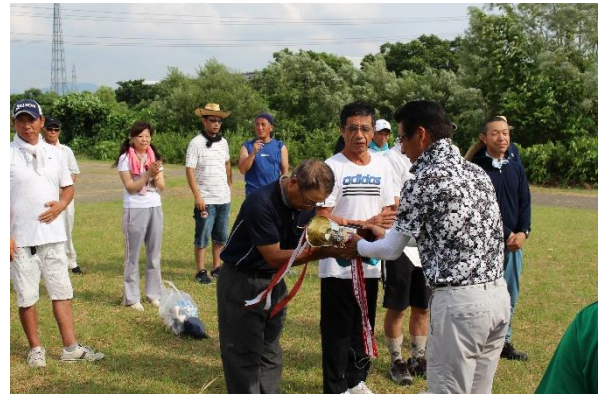
団体優勝 仲間町チーム おめでとうございます!