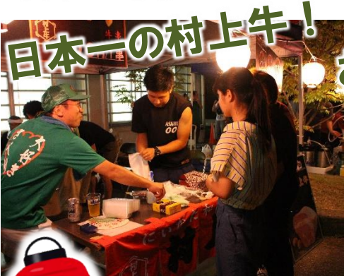
おいしかった♪やきそば 冷たい飲み物!