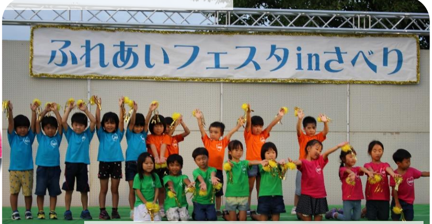
保育園児のかわいらしい「大好き・さべり」!! 元気な踊りがオープニングに花を添えてくれました。