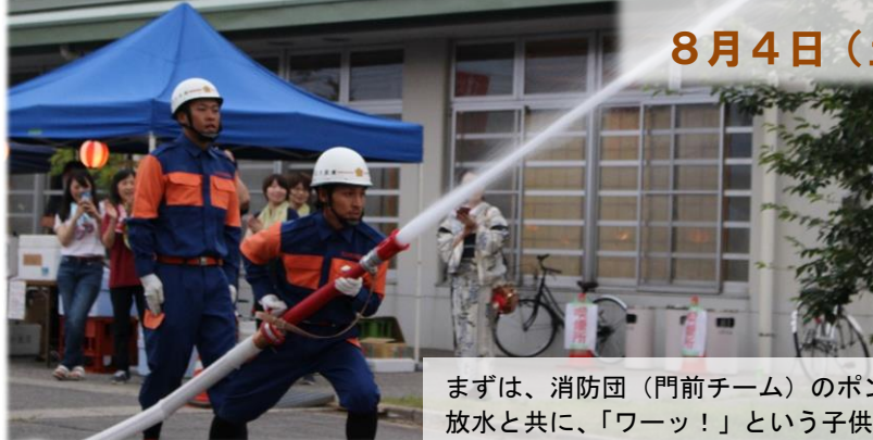
まずは、消防団（門前チーム）のポンプ操作披露です。放水と共に、「ワーッ！」という子供たち歓声が上がりました