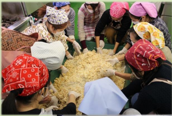
テレビの取材もありました！