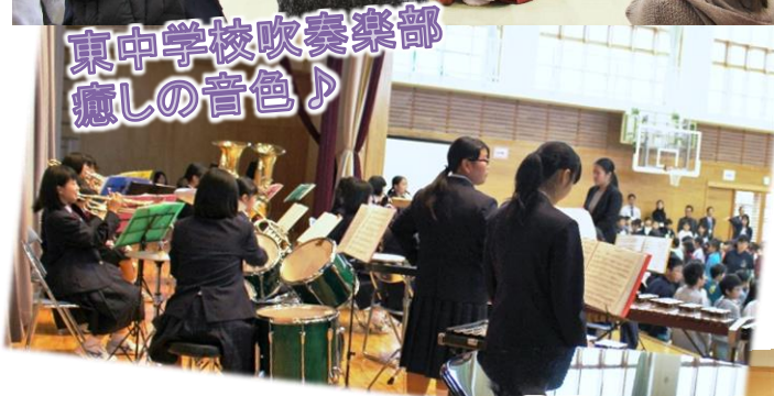
東中学校吹奏楽部 癒しの音色♪