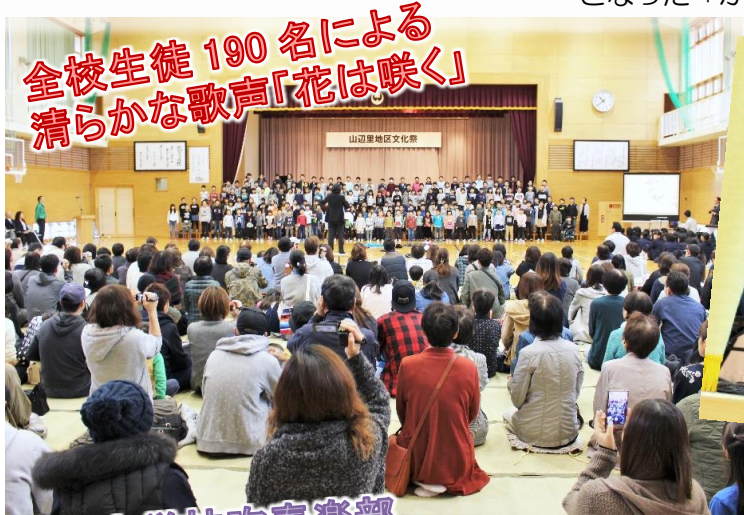
全校生徒 190 名による 清らかな歌声「花は咲く」

○小学校では、芸能発表のほか、児童や地域の方の作品展示、恒例となった「かぼちゃ重さあてクイズ」などを開催しました。