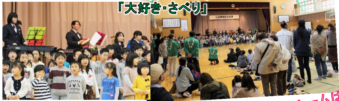
感動のフィナーレは、 「大好き・さべり」