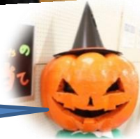
小学校ランチルームは、 地域の作品展と かぼちゃの重さ当て♪

かぼちゃ重さあてクイズ！ 今年のかぼちゃは 13kg(大人)と 5kg(子供)でした！！