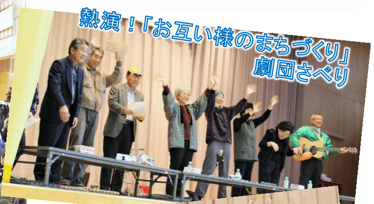
熱演！「お互い様のまちづくり」 劇団さべり