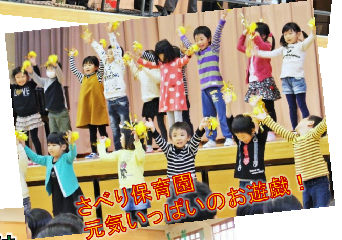
さべり保育園 元気いっぱいのお遊戯！