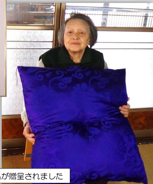
米寿を迎えられた皆様には祝菓子に加え記念品が贈呈されました