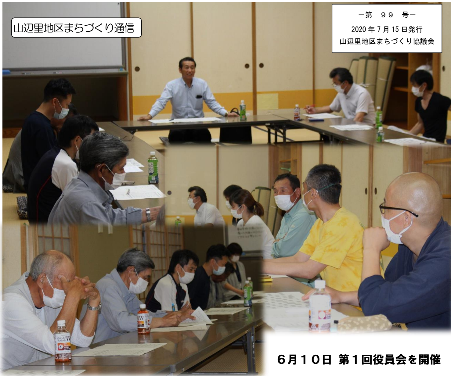
6月10日 第1回役員会を開催