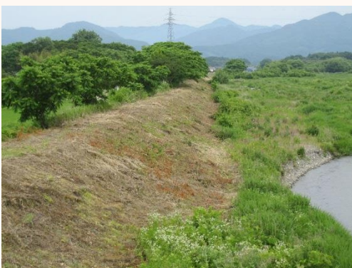
日下の皆さんによりきれいになった門前川の堤防

であり、雑草の刈り取り・除去により、災害を防止するとともに、「里川」の景観を維持し、病害虫の発生抑制や害鳥獣のすみかをなくし、被害を防止するためにたいへん重要な仕事です。6月の第1日曜日頃から、堤防の草刈りがはじまります。作業当日は、集落の住民総出で、朝早くからケガや事故に気をつけながら作業を行います。