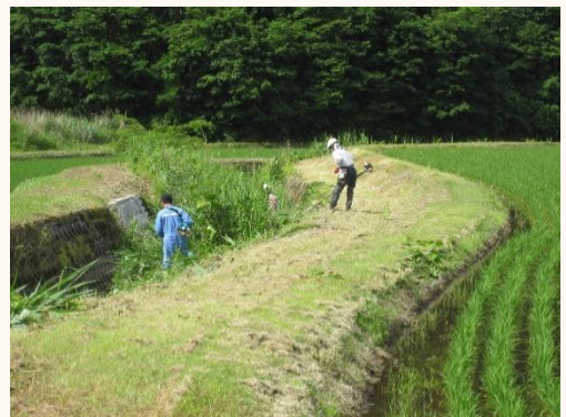
上山田の皆さんの山田川の草刈り作業

田植えが終り、6月に入ると息つく暇もなく、当地区を流れる門前川、山田川、小谷川では、関係集落が 県・市から委託されて、堤防の通路、内・外の法面、川床の雑草刈りを行います。この作業は、毎年の作業