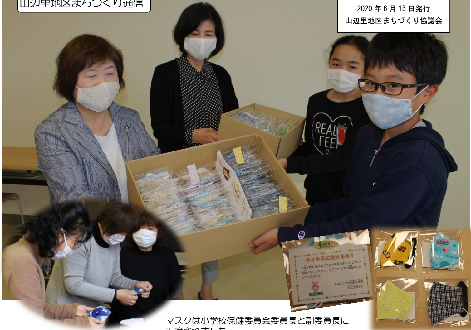
マスクは小学校保健委員会委員長と副委員長に 手渡されました