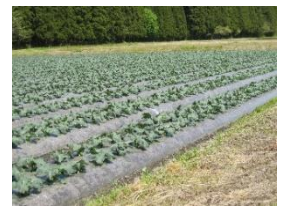
水田転作ブロッコリー