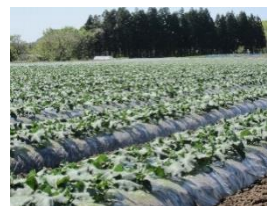
畑のブロッコリー

えたものですが、近年では多く栽培する人は、ペーパーポットで育てた2～3mmの小苗を簡単な道具を使って植えます。