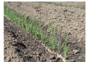
植え付けた小苗のねぎ畑