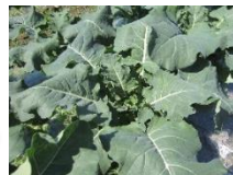
5月上旬のブロッコリー

▼さべりの5月中旬は、どこもかしこも田植えで大忙しです。そのなかであって、春ブロッコリーが、まもなく収穫を迎えようとしています。▼JAにいがた岩船の春ブロッコリーは、県下でも有数の産地で、そのJAにいがた岩船のなかでも、山辺里地区は大多数を占めています。2月20日頃に種まきし、ハウスで苗を育て、4月初め頃に植えたブロッコリーは、まもなく5月末には収穫が始まり、6月上旬にピークを迎えます。気候のよい時期のため、生育が早く、一気に収穫適期となるため、生産者は休むいとまありません。▼他に、ねぎもあります。以前は、小指ほどの苗を植