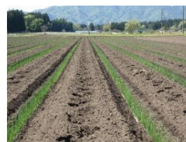
植え付けて間もないねぎ