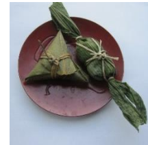
ちまきと笹だんご