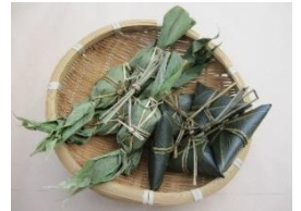
5個ひとまとめた 笹だんごとちまき

でした。今の若い人で笹だんごやちまきを作る人はどの程度いるのでしょうか。手伝わせることで親から子へ、姑から嫁へ、自然と作り方を伝承したものと思われれます。▼一方で、笹には抗菌作用があるといわれ、笹でだんごやもち米を包むことによって、冷蔵庫がない時代でも保存でき、長くおいしさを楽しめたものです。生活の知恵が生み出した保存食です。今後とも、自慢の郷土食、行事食を残していきたいものです。