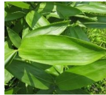
ちょうどよい笹の葉

▼さべりでは、田植えが終わった5月中旬過ぎから6月にかけては、どこの家庭でも、笹だんごやちまきがよく食べられます。今では、お菓子メーカーや業者が専門的に製造し販売していますが、そもそもは、月遅れの端午の節句に各家庭の神棚にお供えするとともに、併せて、県外に行っている子供や親戚に送るために、女性たちがよく作ったものでした。まさしく行事食であり、郷土食です。▼5月下旬から6月初めは、笹の葉がほどよい大きさ、やわらかさになる頃なので、近くの山から笹だんごやちまきを作るのに適したほどよい笹の葉を採ってきて、朝から作っていたもの