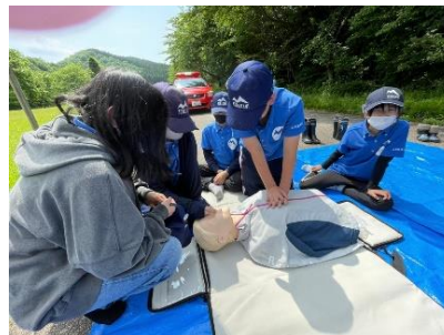
心臓マッサージの講習を受けました

▼5月29日(土)神林地区南大平ダム湖公園キャンプ場で野外訓練活動を行いました。新型コロナウイルス感染症の感染拡大状況から今年度最初の活動となり、初めて顔を合わせる新入団員2名を含む10名の団員が元気よく活動を行いました。▼まずは今年度最初の活動であるため、健民少年団員として必要な動作や規律などの基礎訓練、テント設営訓練を行い、継続加入団員が率先して声を出すなど団結した訓練を行うことができました。▼はんごうすいさんではカレー作りを行い、米とぎ担当、調理担当、火おこし担当と団員が分担して行き、指導員の指示のもとテキパキと安全に作業をすることができました。団員が力を合わせて作った