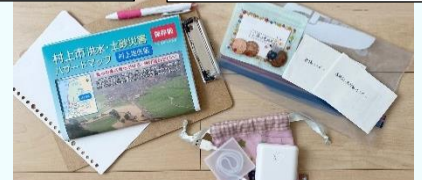
スマホの充電器 保険証や免許証、通帳のコピー