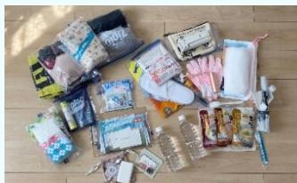
タオル、着替え、衛生用品