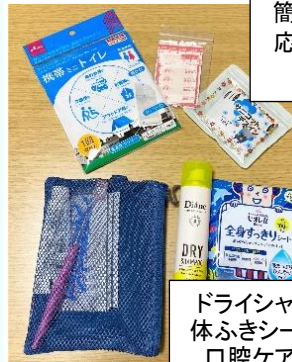
簡易トイレ 応急セット お薬