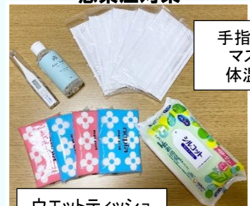
・・・感染症対策・・・