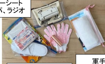
アルミブランケット ホッカイロ