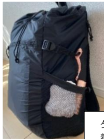
タオル 着替え 衛生用品