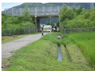
共同で草刈り(天神岡)

草刈りは、重労働でコストもかかる作業ですが、除草剤で草を枯らし再生を抑制することは崩落等土地の劣化につながり、昆虫や小動物の棲息域をなくすることになります。草刈機は、エンジンによりCO 2 を排出しますが、草の再生によりCO 2 を吸収しO 2 を放出してくれます。CO 2 に関しては、機械が排出するより、草が吸収する方が多いと思われます。草刈り作業は、カーボンニュートラルに大いに貢献しているので、もっと評価されてもよい作業です。