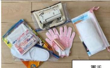
アルミブランケット ホッカイロ