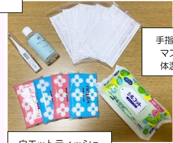
ウエットティッシュ ティッシュ ビニール袋