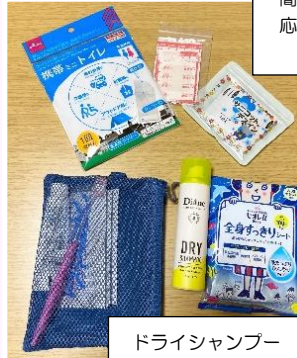
ドライシャンプー 体ふきシート 口腔ケアセット