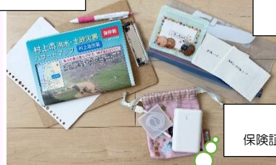
家族の連絡先メモ 10円玉(公衆電話用)