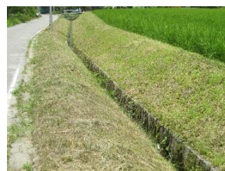
きれいな草刈りあと(門前)