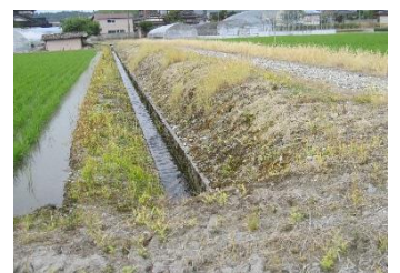
除草剤を使った畦畔・農道