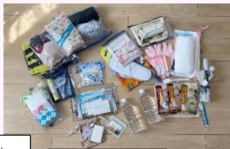
レジャーシート スリッパ ラジオ