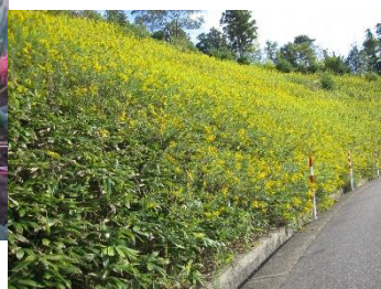
他の草種が入り込めない セイタカアワダチソウ