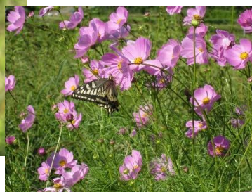
コスモスとキアゲハ